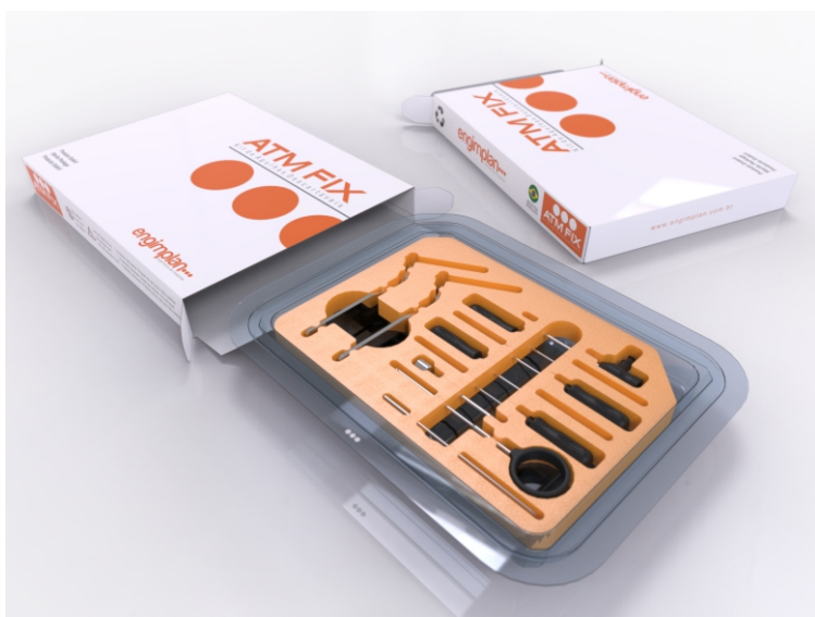
Kit cânula para fixação do disco mandibular